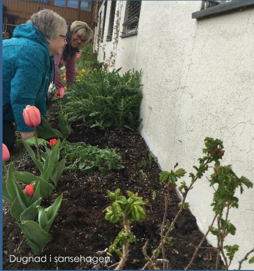
Dugnad i sansehagen.